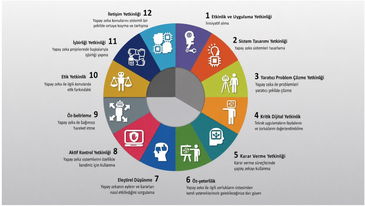
(Şekil 2: AIComp Modelinden 12 Yetkinlik Alanı)

BAIFE (2024) çerçevesi; YZ'nin müfredata entegrasyonunu, hem teknik hem de etik anlayışı ve öğrencilerin YZ'nin toplumsal etkisini kavramak için eleştirel düşünme becerilerini geliştirmesini teşvik etmektedir. Belge, öğrencileri hızla gelişen teknolojik ortama hazırlamada YZ yetkinliğinin önemine dikkat çekmektedir. Çerçeve üç temel soruyu ele almaktadır: YZ nedir? Nasıl çalışır? Nasıl ve neden kullanılır?