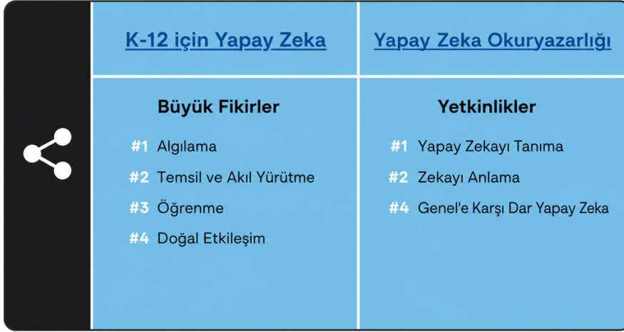
(Şekil 4: YZ Nedir?: YZ Okuryazarlığı Yetkinlikleri)

"Nasıl çalışır?" boyutunda geliştirilmesi önerilen yetkinlikler şunlardır: