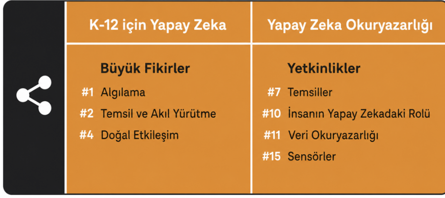
(Şekil 5: YZ Nasıl Çalışır?: YZ Okuryazarlığı Yetkinlikleri)

ETAAI (2024), UNESCO'nun eğitimcilere yönelik YZ yetkinlik çerçevesine ve çeşitli akademik çalışmalara atıfta bulunarak YZ yetkinlik çerçevesini dört boyutta ele almaktadır: (1) Bilgi Boyutu: Makine öğrenmesi ve doğal dil işleme (NLP – Natural Language Processing) uygulamaları dahil YZ'nin temellerini anlama. (2) Uygulama Boyutu: Sanal laboratuvarlar, akıllı öğretim platformları ve kişiselleştirilmiş öğrenme sistemleri gibi YZ araçlarını öğretim uygulamalarına entegre etme. (3) Beceriler Boyutu: YZ araçlarını, veri analizini ve model eğitimi kullanmada yeterlilik. (4) Değerler Boyutu: Veri gizliliği ve algoritmik önyargı gibi etik endişeleri ele alma; öğrencilerde YZ etiği ve toplumsal sorumluluk farkındalığını geliştirme.