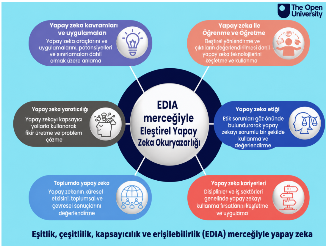
(Şekil 6: AFLTOU Çerçevesi)

AFLTOU (2025) kapsamlı bir yetkinlik listesi sunmaktadır: Dijital okuryazarlık, algoritmik okuryazarlık, hesaplamalı düşünme, veri okuryazarlığı, etik YZ farkındalığı, makine öğrenmesi okuryazarlığı, insan-YZ iş birliği becerileri ve eleştirel YZ okuryazarlığı.